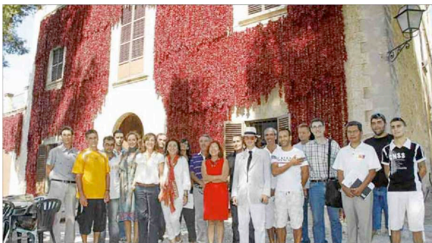
Las autoridades, junto a los participantes de distintos colectivos y ante los 'enfilalls' de la fachada de Son Boter.