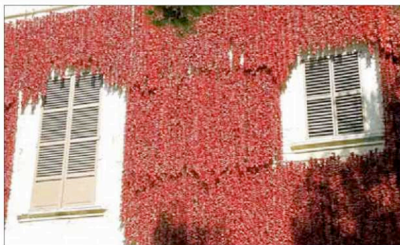
Las ristras han sido dispuestas con un sistema que no daña la piedra.

Para esta ocasión lució con todo su esplendor en la fachada de Son Boter el trabajo de recuperación de los típicos enfilalls de pimientos de tap